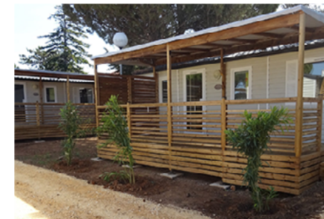
Camping Le Rayolet - Six-Fours-les-Plages

Pour plus d'informations sur les conditions d'accueil, nous consulter.